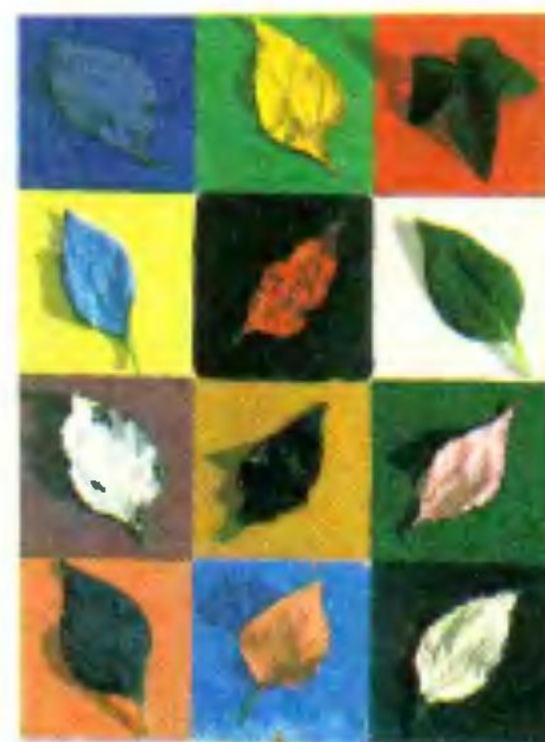
Обложка А. Обросковой. Ю. Сарафанова

На первой и второй страницах обложки художники попытались выразить идеи статей С. Глейзера «Посланники живой грозы» и Л. Белоусова «Как клетки зародыша определяют свою судьбу». В этой связи читателю интересно будет узнать, что Нобелевская премия по медицине и физиологии за 1995 год присуждена первооткрывателям генов, управляющих развитием зародыша. Об их работе читайте в майском номере нашего журнала.