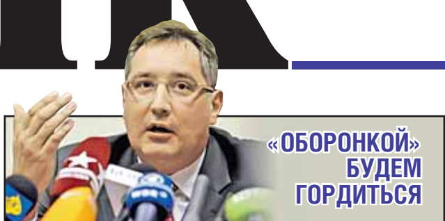
«ОБОРОНКОЙ» БУДЕМ ГОРДИТЬСЯ

Выступление Дмитрия Рогозина в Государственной думе