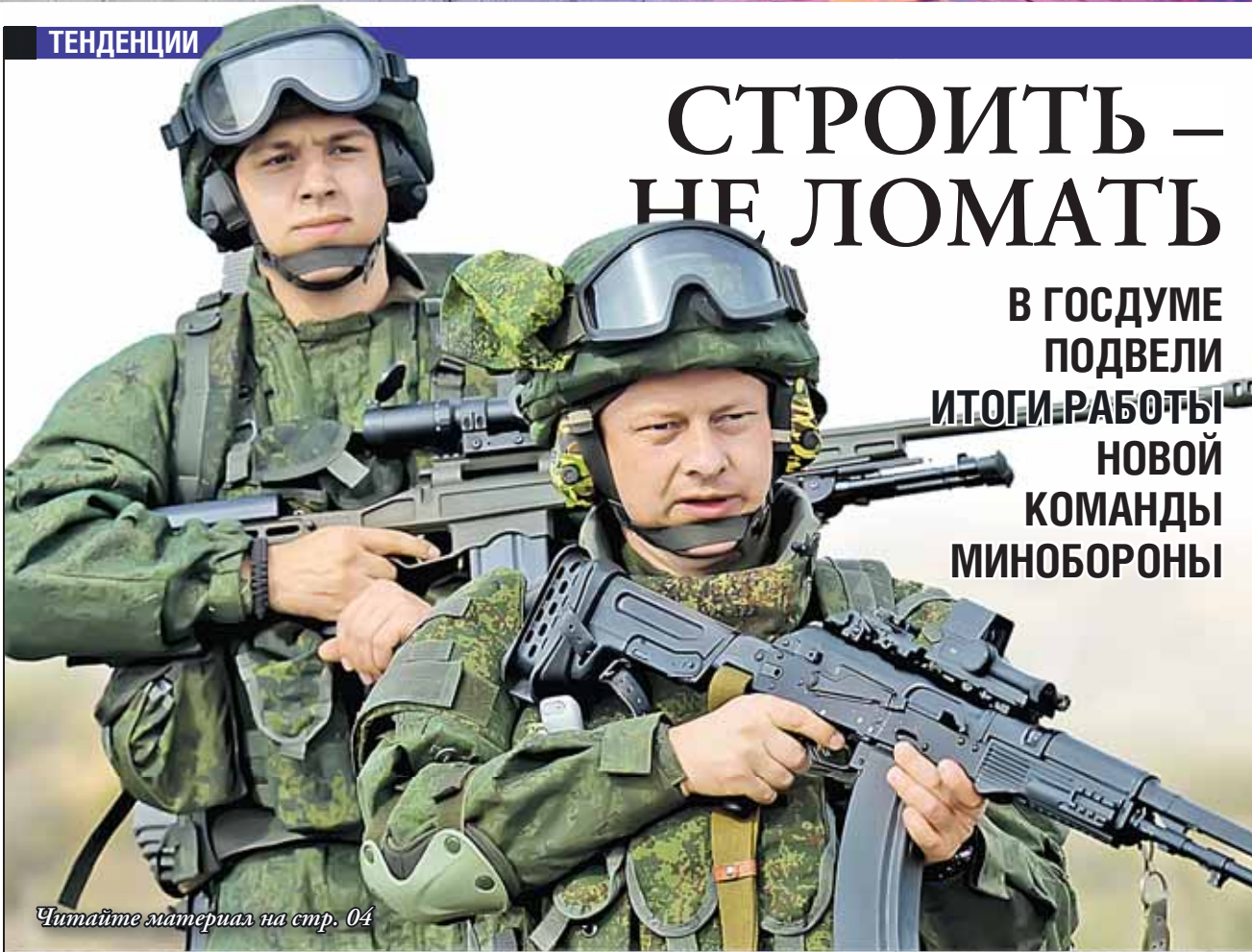
Читайте материал на стр. 04