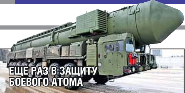
ЕЩЕ РАЗ В ЗАЩИТУ БОЕВОГО АТОМА

На страницах «ВПК» продолжается дискуссия о роли ЯО