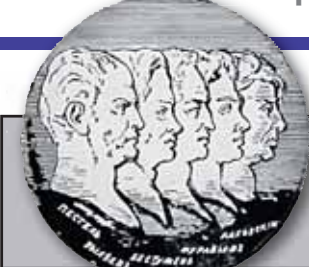
СТЕПАН РАЗИН, КЛАРА ЦЕТКИН, ДЕКАБРИСТЫ...

Один из нерешенных в армии – вопрос идеологии, героизации ее военной истории