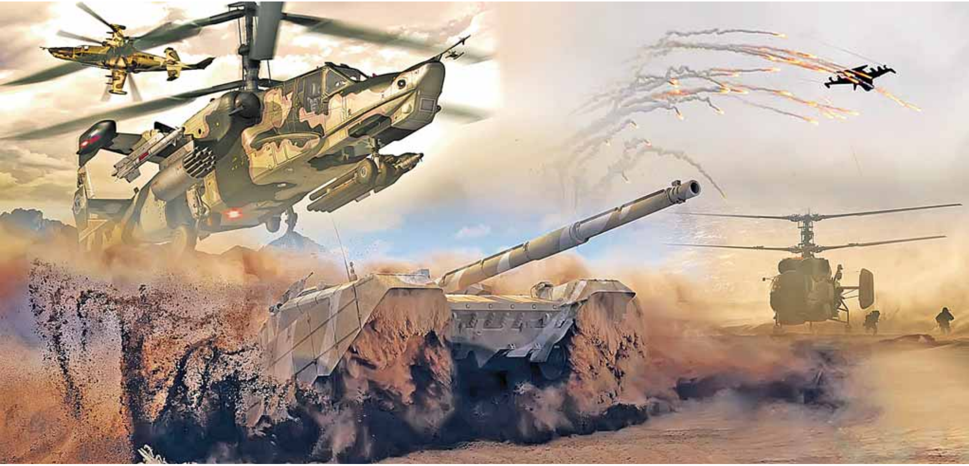
Коллаж Андрей СЕДЫХ

Что касается 12 месяцев срока службы по призыву, смущает не сама продолжительность, а установленный порядок призыва и увольнения два раза в год. При такой системе личный состав каждые полгода меняется на 50