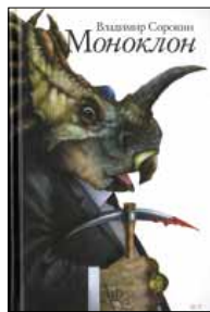
Сорокин В. Моноклон. М.: Астрель, АСТ, 2010. — 288 с.

5 На первый взгляд этот сборник рассказов разительно отличается от других книг Владимира Сорокина. Например, в нем никто не ест кала. И нет слов на букву «х» и им подобных. Однако. Открываешь в одном месте: а там — «Ох, насрели в сиси/Кузнецовой Ларисе». Откроешь в другом — «Я забил в тебя, киса». Тут-то и вздохнешь с облегчением, ибо понимаешь — не оскудел талант.