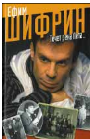
Шифрин Е. Течет река Лета. М.: АСТ, Астрель; Владимир: ВКТ, 2010. — 352 с.

4 Миллионам людей Ефим Шифрин известен как комедиант. Несколько меньшему числу — как драматический, а порой трагический актер. Еще меньшему — как ЖЖ-юзер koteljnik, автор точных постов на самые актуальные темы. «Река Лета» откроет множеству читателей Шифрина-философа, у которого даже дневниковая запись превращается в непростое размышление.