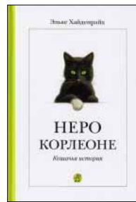
Хайнрайх Э. Неро Корлеоне. Кошачья история. / Пер. с нем. В. Позняк и Н. Федоровой / Ил. К. Бухгольца. М.: Самокат, 2010. — 88 с.

7 Свое имя «Неро» главный герой получил за то, что он черный. А вторую часть имени — «Корлеоне», что означает «Львиное сердце» — за то, что был храбр и никого и ничего не боялся. Ему понадобилось шесть недель, чтобы стать полноправным хозяином фермы и заслужить уважение всех ее обитателей. И самое главное: он — всего лишь маленький котенок.