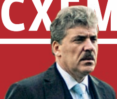
СХЕМА БУТА. КАК ПРОДАТЬ РАКЕТУ стр. 39

ХОЗЯИН ГРУДИНИН. Отчего хозяин совхоза имени Ленина не хочет быть миллиардером стр. 44