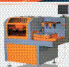
Полуавтоматический принтер B70