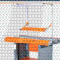
Ремонтная станция B1R