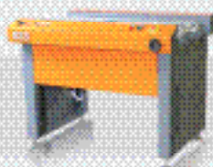
Конвейерная система B2b