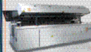
Печь конвекционного оплавления RENN VXB air 2100 (тип 421)