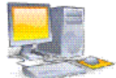
Организация системы прослеживаемости производства изделий электроники