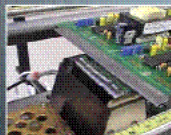
Управление параметрами волновой пайки электронных модулей