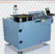
Автоматический загрузчик BZ 01