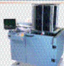
Автоматический разгрузчик BR 01