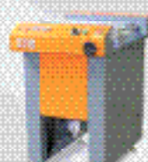
Конвейерная система B1b