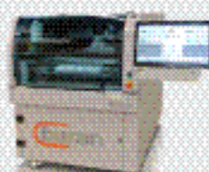
Автоматический принтер трафаретной печати «Бурла» B100