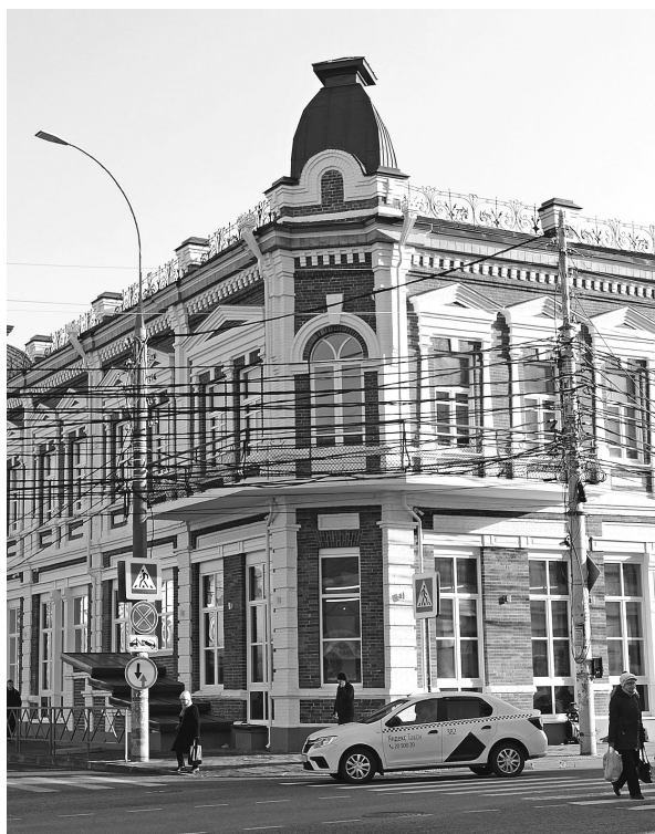
Краевой Дом журналистов разместился в отреставрированном старинном особняке в центре Краснодара.

В Краснодаре открыли краевой Дом журналистики, где и наградили репортеров