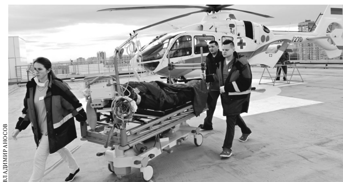
«Ансат» с пациентом приземляется на вертолетную площадку, расположенную на крыше одного из корпусов ККБ-1.