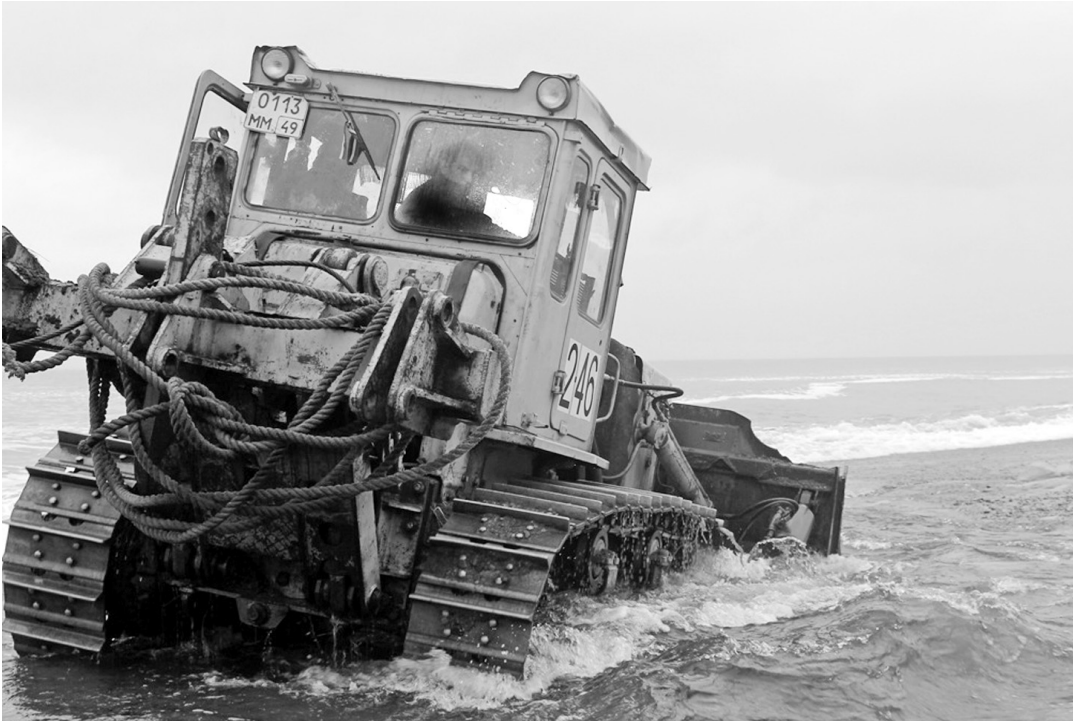
ПРЕСС-СЛУЖБА ПРАВИТЕЛЬСТВА МАГАДАНСКОЙ ОБЛАСТИ

В ПРИМОРЬЕ проходят учения по поиску и эвакуации космонавтов из спускаемого на воду аппарата. В них участвуют спасатели Тихоокеанского флота, а также представители командования ВВС и ПВО, Росавиации и Роскосмоса. Практическую отработку полученных знаний тихоокеанцы продемонстрируют сегодня, 7 августа, в условном месте приземления в акватории Уссурийского залива.