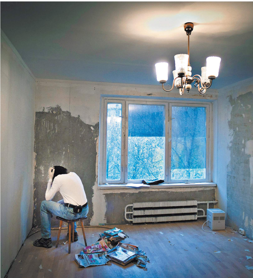
За окном уже давно темно, а из-за стены продолжает раздаваться визг дрели. Жаловаться бесполезно. Обычная история, ход которой намерены изменить законодатели.