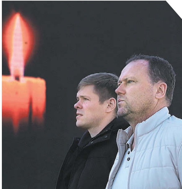
Федор Успенский «СЭ»