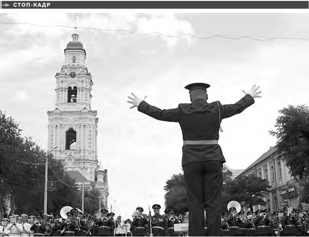
В честь 460-летия Астрахани и векового юбилея Северо-Кавказского военного округа прошел фестиваль духовых оркестров «Фанфары Каспия». В параде у стен Астраханского кремля приняли участие 12 музыкальных коллективов. Среди них — военный оркестр штаба Южного военного округа из Ростова-на-Дону, ставший участником международного военно-музыкального форума «Спасская башня» в столице. А в воскресенье оркестры прошли по улицам города-именинника.

В ПЕРВУЮ десятку, по версии сайта Domofond.ru, попали Волгоград, Астрахань, четыре города из Московской области, Рубцовск Алтайского края и три донских города: Новошахтинск, Шахты и Новочеркасск. Самыми безопасными оказались Грозный, Анапа и Геленджик. 60 тысяч участников опроса должны были под утверждением: «Я живу в безопасном районе и не боюсь идти домой в темное время суток» проставить цифры от 1 до 10.