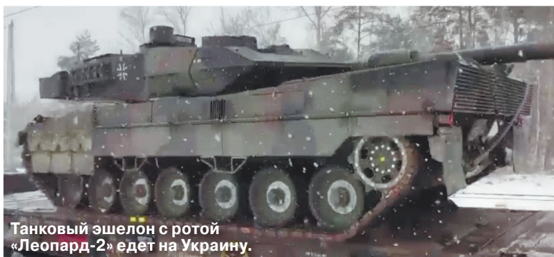
Танковый эшелон с ротой «Леопард-2» едет на Украину.

В ночь на 26 января возобновились ракетные удары по инфраструктуре Украины после почти двухнедельной паузы. Примечательно, что удары возобновились после переговоров на немецкой авиабазе в Рамштайне и объявления о массовой поставке на Украину наступательных вооружений.