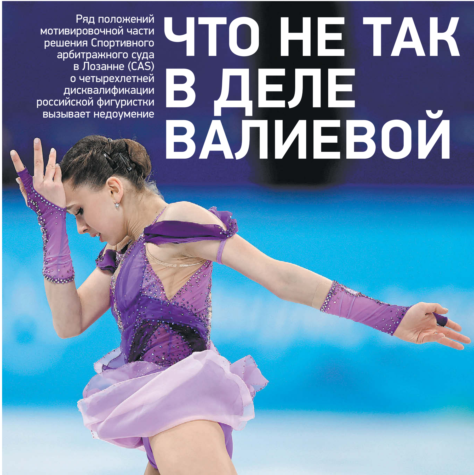
Февраль 2022 года. Пекин. Камила Валиева на Олимпиаде