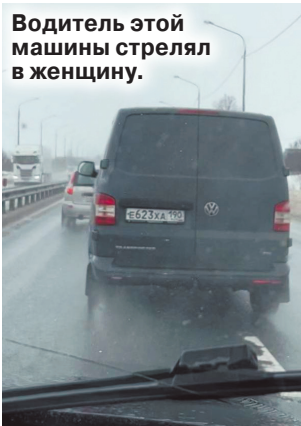
Водитель этой машины стрелял в женщину.

47-летняя женщина получила серьезное огнестрельное ранение в результате дорожного конфликта в Луховицком городском округе Подмосковья. От неминуемой смерти ее спасло, что пуля попала в бровь: выстрел был сделан практически в упор.