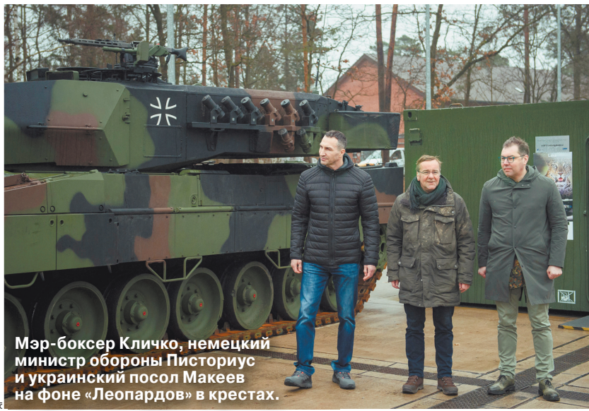
Мэр-боксер Кличко, немецкий министр обороны Писториус и украинский посол Макеев на фоне «Леопардов» в крестах.