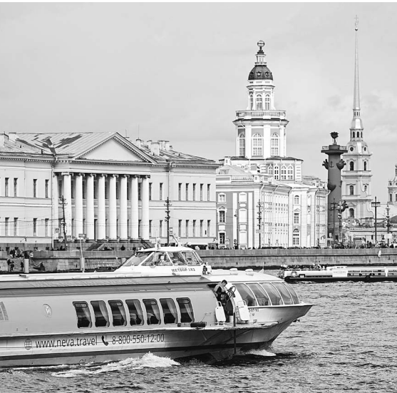
Научный квартал объединит здание РАН с Кунсткамерой и другими зданиями.

На Васильевском острове в Петербурге планируется создать научный квартал, центром которого станет комплекс зданий РАН на Университетской набережной. Предполагается, что в Музейном флигеле будет открыт музейный центр науки и технологий, а все научные и образовательные учреждения свяжут единой системой публичного пространства.