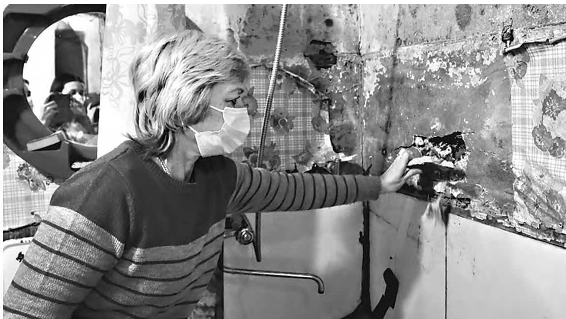
ОТДЕЛЕНИЕ ОНФ ПО НИЖЕГОРОДСКОЙ ОБЛАСТИ

Ветхий дом в центре города включен в план капремонта