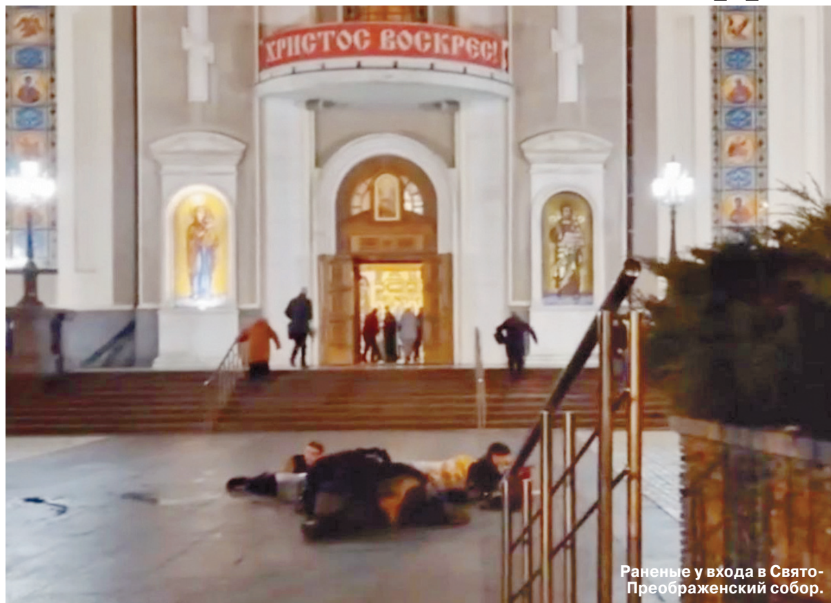
Раненые у входа в Свято-Преображенский собор.

Украинский «Град» выпустил 20 ракет по центру города