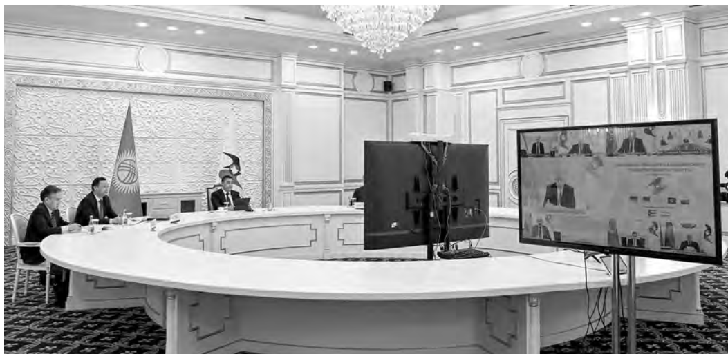
ПРЕСС-СЛУЖБА ПРЕЗИДЕНТА КР