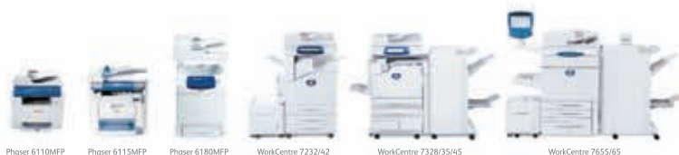
Phaser 6110MFP Phaser 6115MFP Phaser 6180MFP WorkCentre 7232/42 WorkCentre 7328/35/45 WorkCentre 7655/65