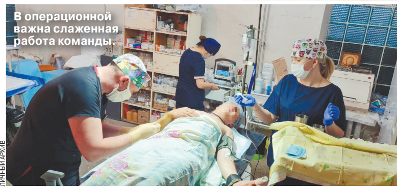
В операционной важна слаженная работа команды.