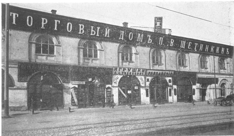
Оптовый складъ въ Казани.