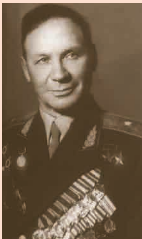
Владимир Коккинаки ▲