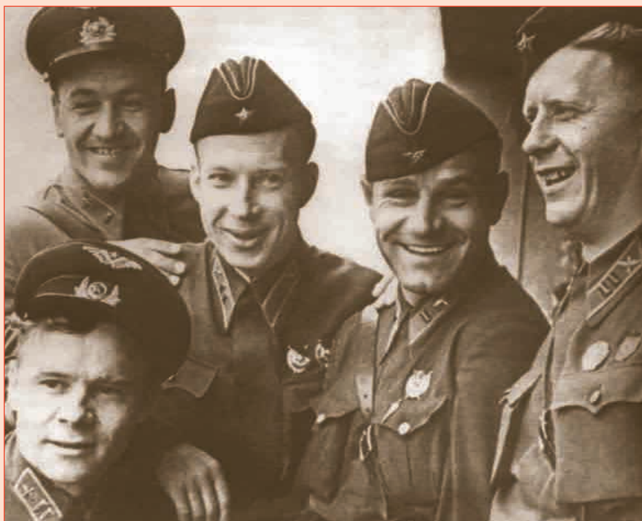
▲ Лётчики-испытатели НИИ ВВС — участники показательного пилотажа «красной пятёрки»