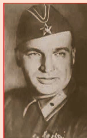
▲ Валерий Чкалов