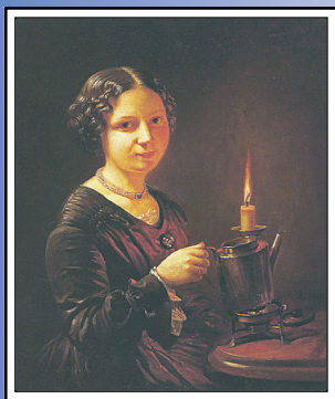
В. Тропинин Девушка со свечой 1840-е гг.