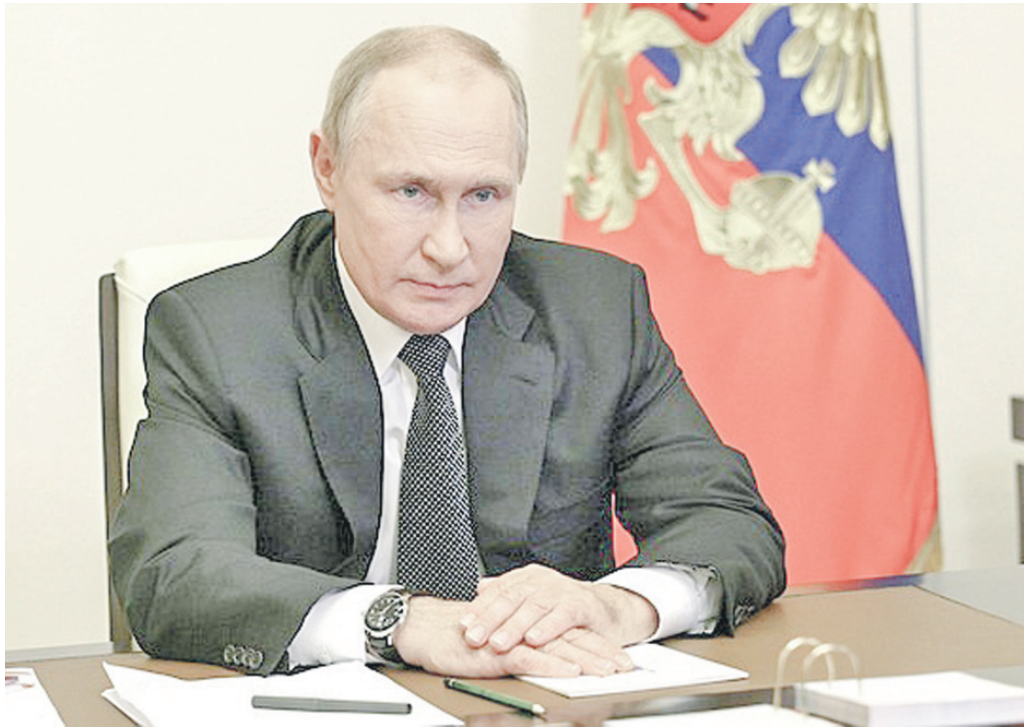
Президент Российской Федерации Владимир Путин в режиме видеоконференции провёл заседание Совета Безопасности РФ.

Открывая заседание, Владимир Путин сказал: - В ходе референдума жители Донецкой и Луганской народных республик, Запорожской и Херсонской областей твёрдо и однозначно выразили свою волю - они хотят быть вместе с Россией. Конституционные законы о принятии в состав Российской Федерации четырёх новых регионов вступили в силу. Киевский режим, как известно, отказался признать волю и выбор людей, отвергает любые предложения о переговорах. Напротив, продолжают обстрелы, гибнут мирные люди. Неонацисты используют откровенно террористические методы, диверсии на объектах