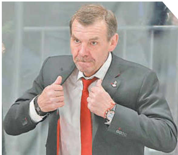
Александр Федоров «СЭ»/ Canon EOS-1DX Mark II