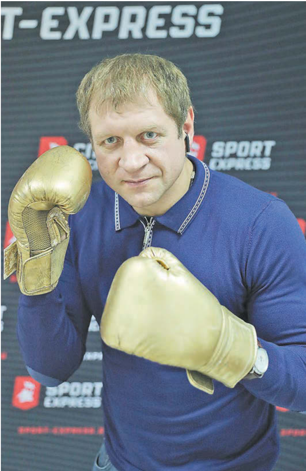
Вчера. Москва. Александр Емельяненко в редакции «СЭ»

29 ноября в Москве состоится бой между легендой ММА Александром Емельяненко и самым титулованным российским стронгменом – Михаилом Кокляевым. За два месяца до поединка Емельяненко пришел в гости к «СЭ» и рассказал, как собирается победить 140-килограммового силача