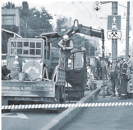
Бурить асфальт и класть новый строительм придется по ночам.