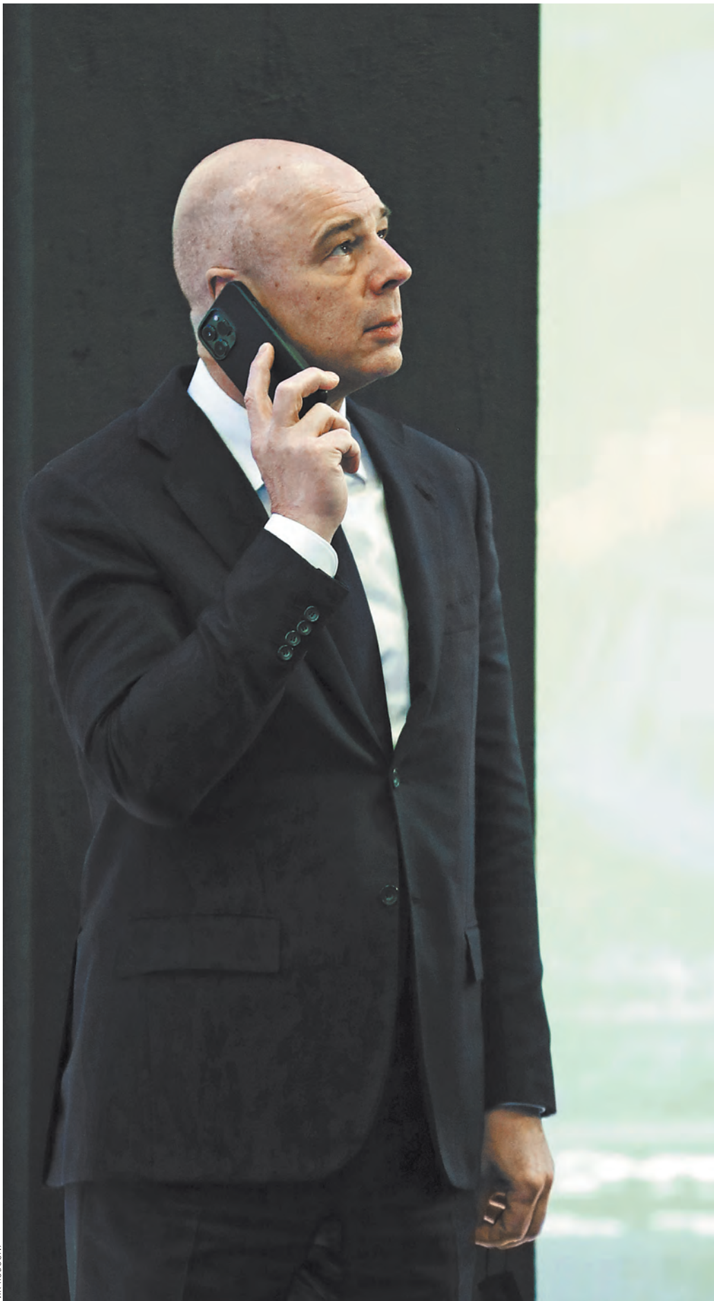
Антон Силуанов: За два месяца 2023 года в бюджетную систему поступило более 5 трлн рублей налоговых доходов. Я думаю, те, кто прогнозировал нам большой дисбаланс, будут очень сильно расстраиваться.