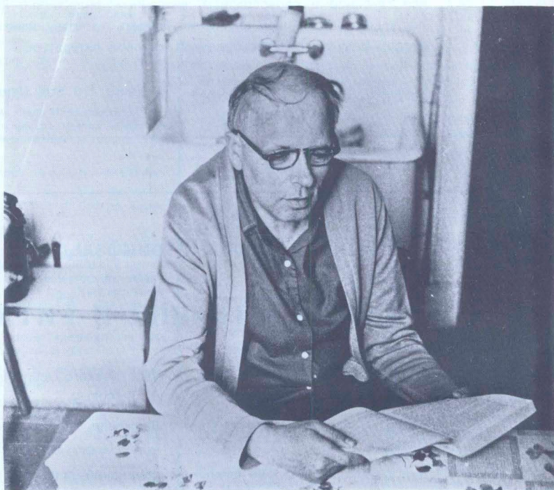
АНДРЕЙ ДМИТРИЕВИЧ САХАРОВ

ЕЖЕМЕСЯЧНЫЙ ОБЩЕСТВЕННО - ПОЛИТИЧЕСКИЙ ЖУРНАЛ