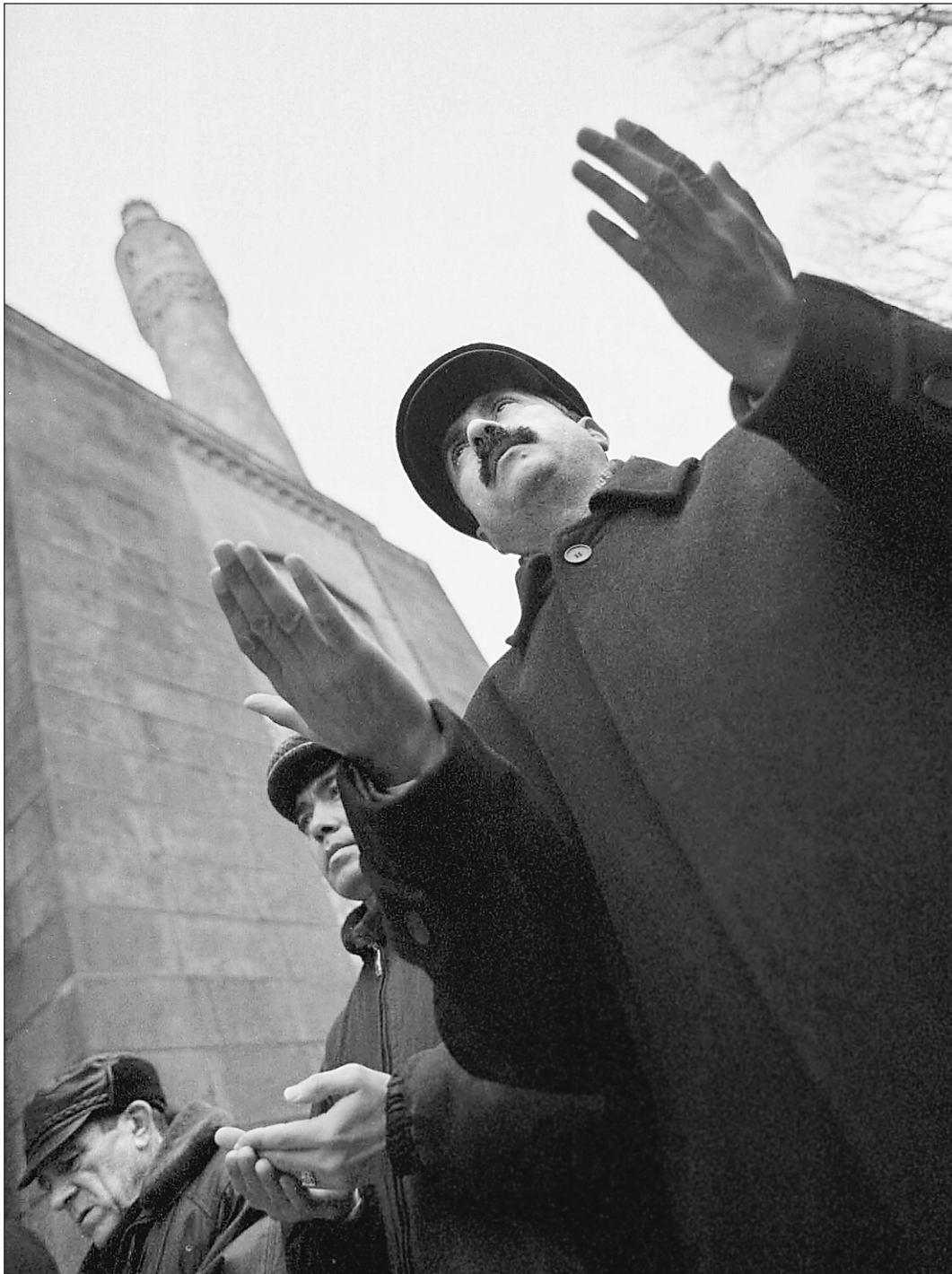
Одной молитвы недостаточно

— Ни к чему хорошему это противостояние не приведет, — заявил «Известиям» верховный муфтий России, глава Центрального духовного управления мусульман России и европейских стран СНГ шейх уль-ислам Талгат Таджуддин. — Если возник какой-то бюрократический конфликт, то в первую