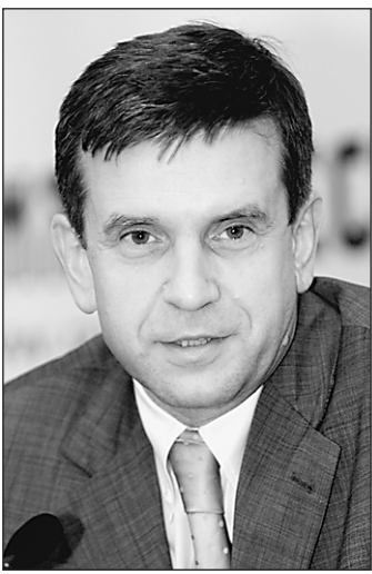
— Когда начнется эксперимент?

— Поручение Касьянова практически согласовано. Я думаю, что до 1 марта оно будет подписано, и первые деньги территории начнут получать 1 апреля.