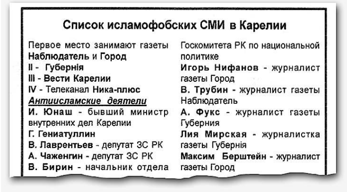
Вырезка из карельской газеты «Прямой путь»