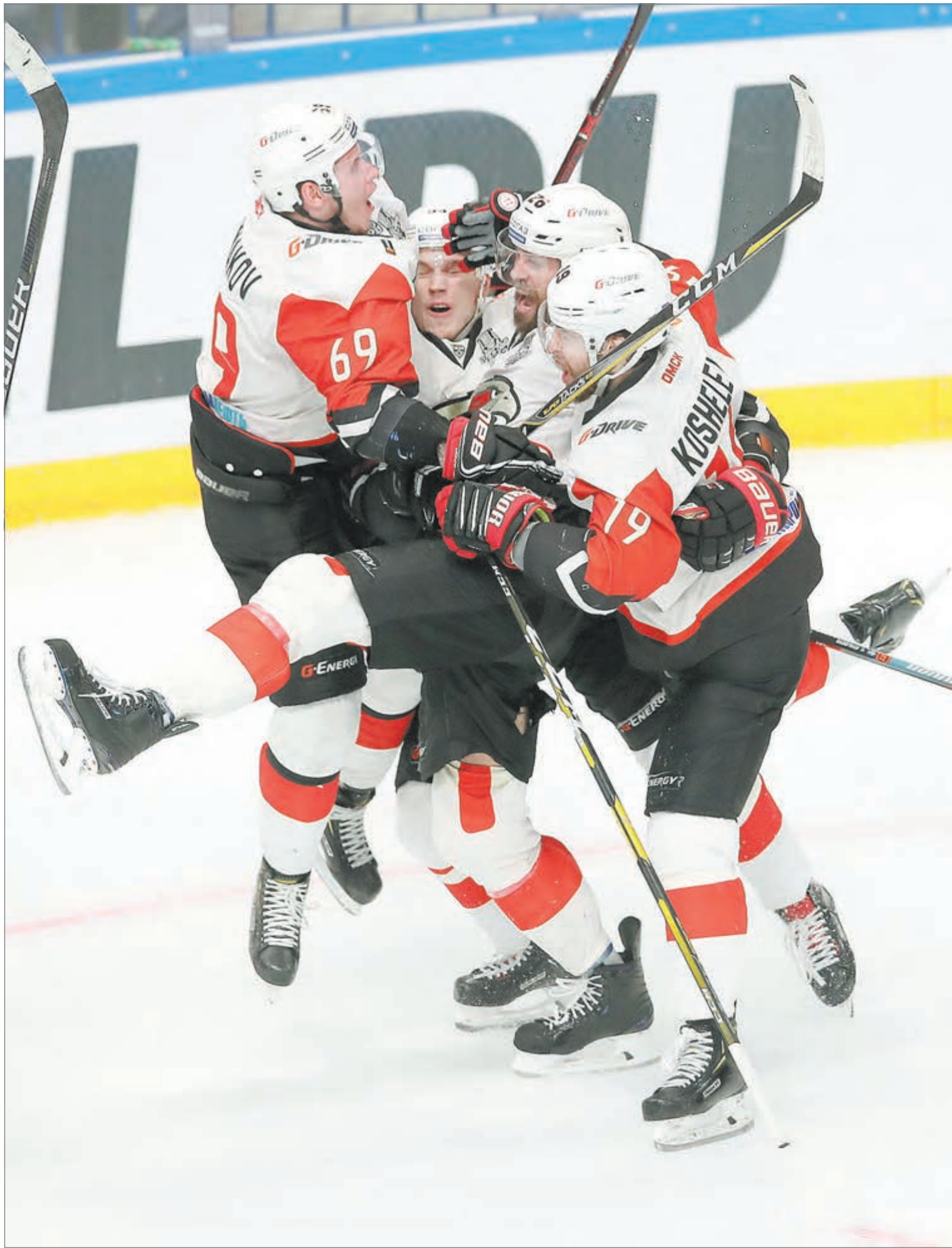
Вчера. Уфа. «Салават Юлаев» - «Авангард» - 0:1 ЗОТ. «Ястребы» празднуют выход в финал Кубка Гагарина.

«Авангард» обыграл «Салават Юлаев» (1:0), забросив победную шайбу в третьем овертайме шестого матча серии, и вышел в финал Кубка Гагарина. Сегодня во встрече ЦСКА - СКА определится соперник «ястребов».