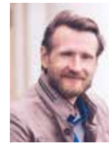
Александр Скворцов – фотограф, снявший наших паралимпийцев для обложки этого номера и множество других съемок к материалам «Я – МОГУ!»