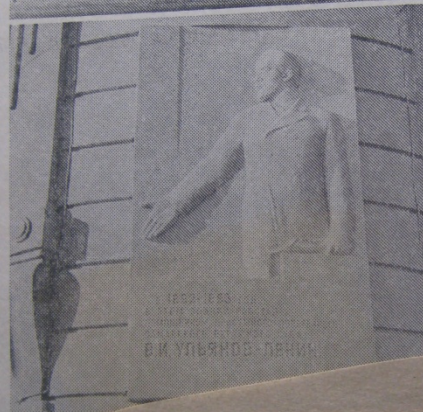
Мемориальная доска на здании суда. На ней написано: «В 1892—1893 годы в этом здании работал помощником присяжного поверенного Самарского окружного суда В. И. Ульянов — Ленин».