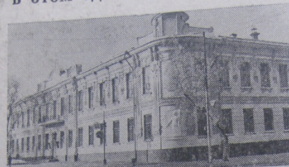
Здание Куйбышевского областного суда.