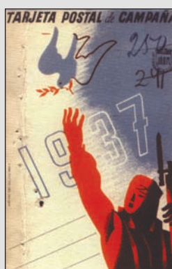
▲ Почтовая карточка республиканской Испании 1937 г.