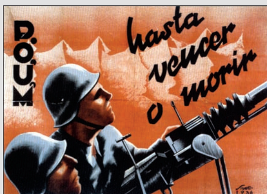
▲ «Победить или умереть!» Агитационный плакат (на испанском языке)