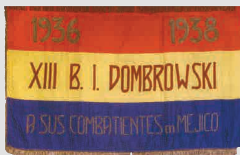
➤ Знамя XIII интербригады им. Домбровского