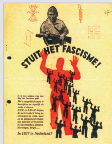
➤ «Остановить фашизм!» Листовка (на голландском языке)