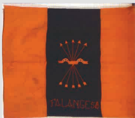
▲ Знамя подразделения фалангистов, воевавших в составе войск генерала Франко