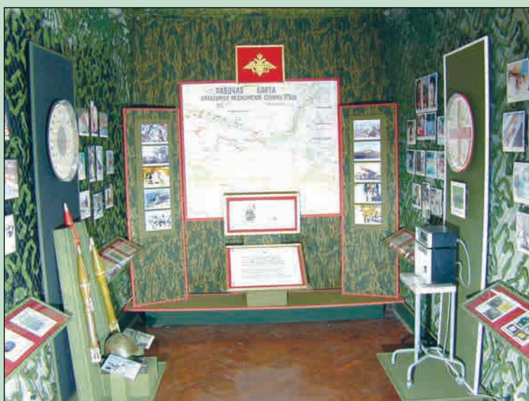
▲ Общий вид зала «Медицина вооруженных конфликтов» в экспозиции Военно-медицинского музея