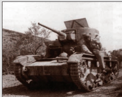
▲ Танк советского производства, захваченный франкистами у республиканцев

«Гражданская война в Испании 1936—1939 гг.»