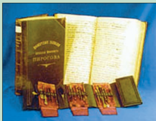
Экспонаты зала «Советская медицина в Великой Отечественной войне 1941–1945 гг.» ▼