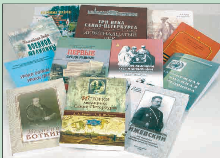
▲ Научные труды сотрудников Военно-медицинского музея