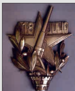
➤ Навершие древка знамени интербригад