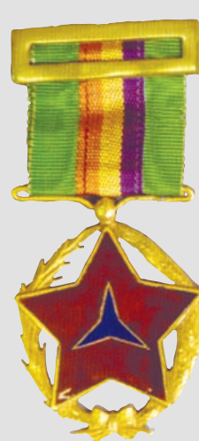
▲ Медали участников антифашистского движения