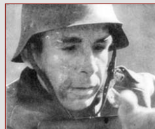
Боец республиканской армии