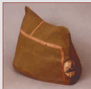
Пилотка с эмблемой бойца народной милиции, принадлежавшая Рубену Ибаррури