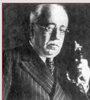
Мануэль Асанья — президент Испанской республики