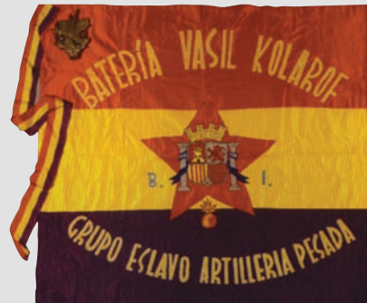
▲ Знамя интернациональной батареи имени В. Коларова 1937—1939 гг.