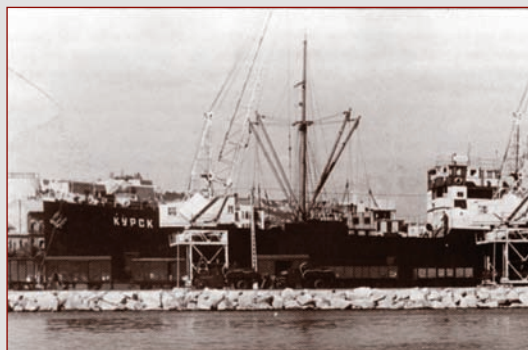
Советский пароход «Курск» с военными материалами в порту Аликанте 1936 г.