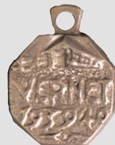
▲ Памятные медали