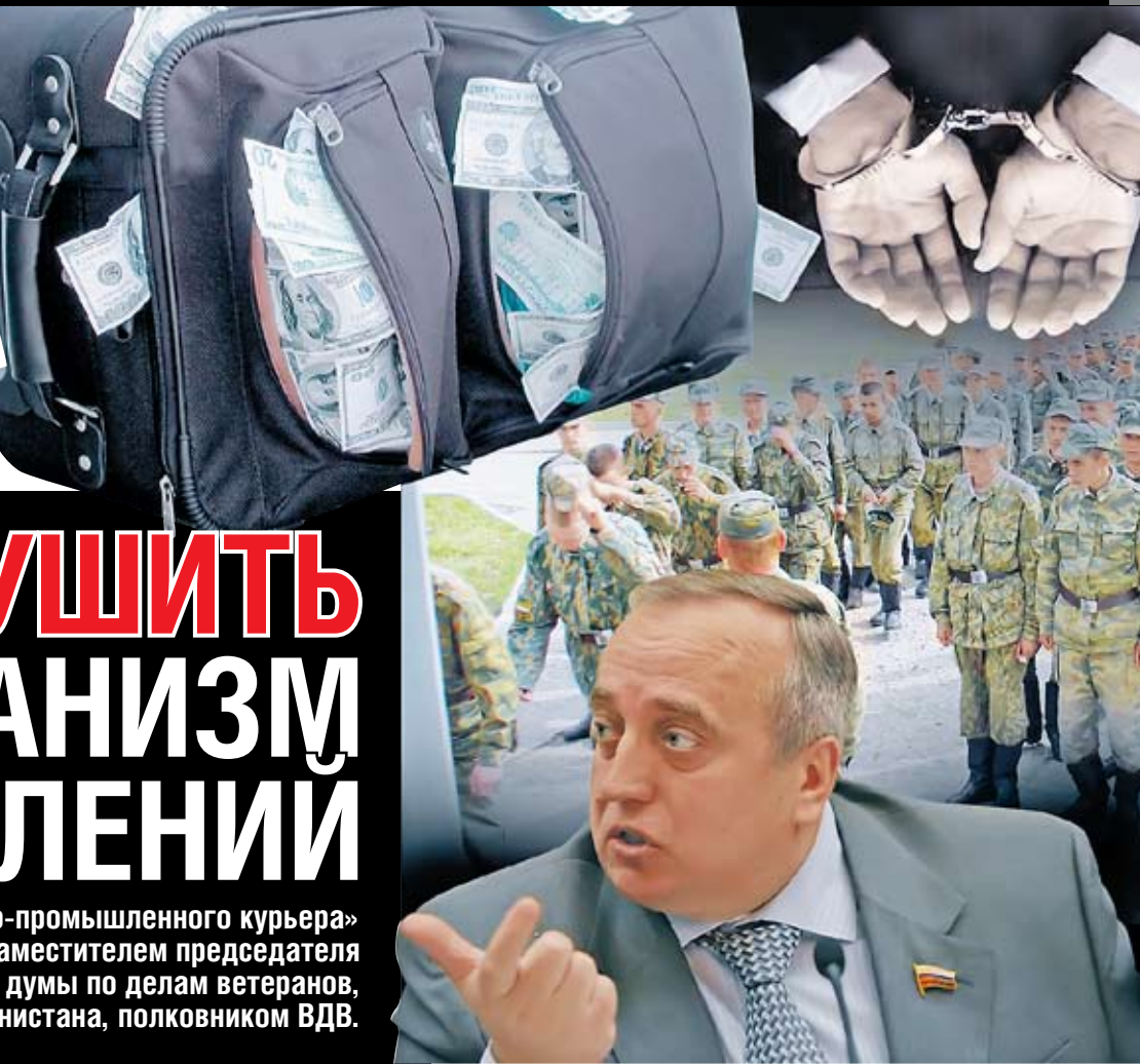
Коллаж: Андрей СелДХ

— Надзорные органы и так хорошо работают. Необходимости расширять их полномочия нет. Эффективности эта мера не принесет. Коррупция — всеобъемлющий, пожирающий, разрушающий всю