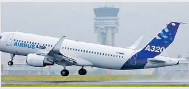
По сообщениям корреспондентов «ВПК», информгентств АРМС-ТАСС и Интерфакс-АВН