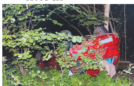
После ДТП в Чеховском районе

15-летняя девушка погибла в ДТП в Чеховском районе, когда вместе с друзьями-ровесниками возвращалась на машине домой. 17-летний водитель вре- зался в выбежавшего на трассу лося, в результате автомобиль съехал в кювет.