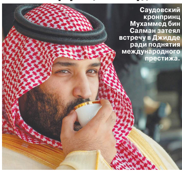
Саудовский кронпринц Мухаммед бин Салман затеял встречу в Джиdde ради поднятия международного престижа.

Зачем Киеву понадобилась «мирная конференция» в Саудовской Аравии