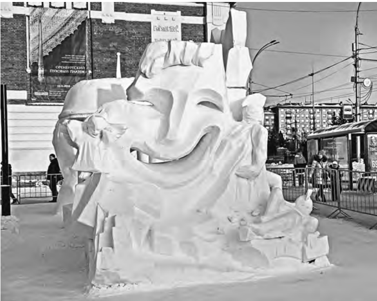
В Новосибирске завершился фестиваль снежных скульптур. Главный приз достался мастерам из Санкт-Петербурга, изважавшим царевну Лебедь из сказки Пушкина (композиция «Превращение»). На втором месте — команда из Омска со скульптурой деда Мазая, спасающего зайцев. Бронзу получили новосибирцы за композицию «Арлекин» (на снимке).