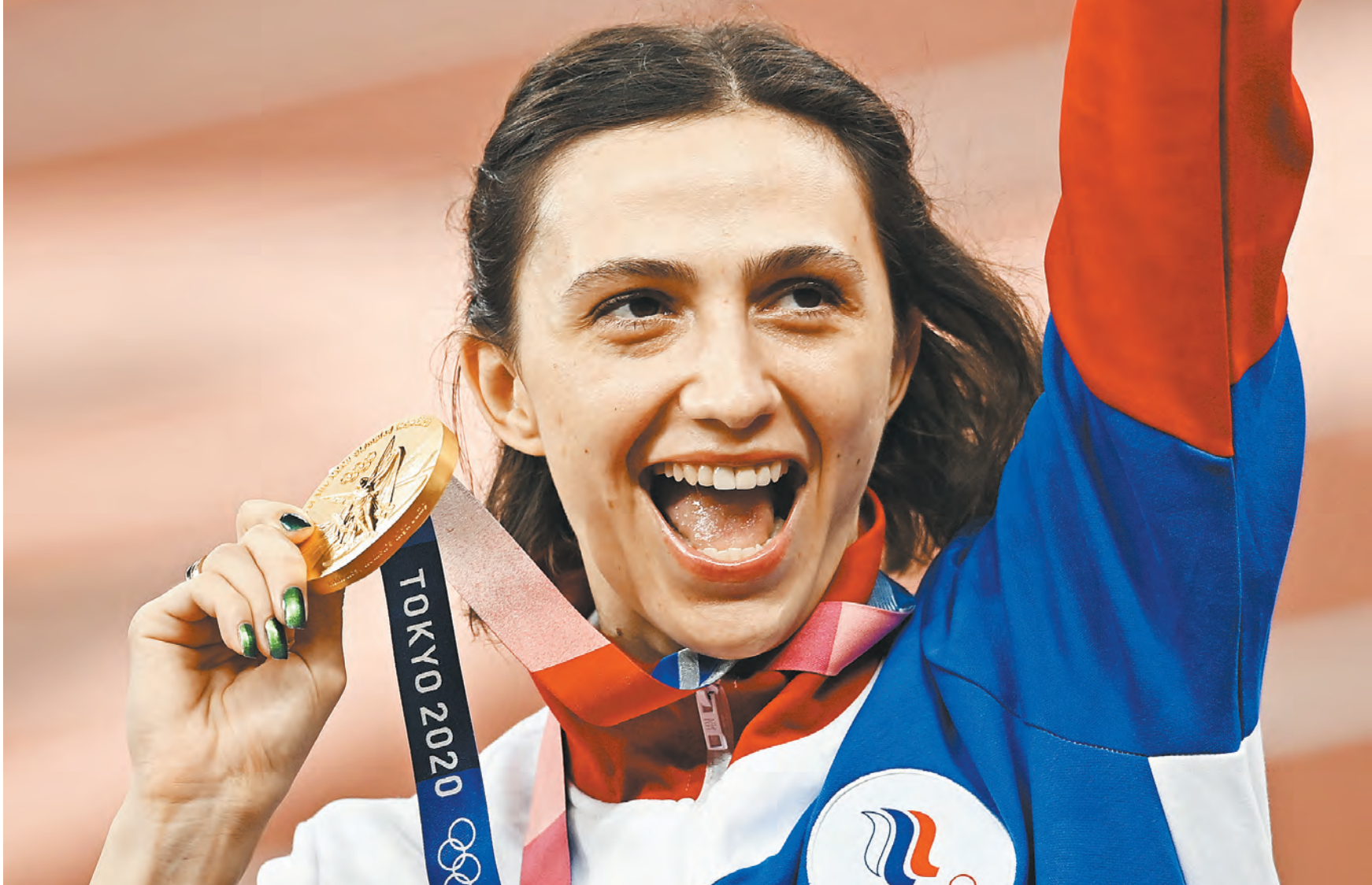
Золотой полет Марии Ласицкене в секторе по прыжкам в высоту стал одним из самых ярких моментов прошедшей Олимпиады.

Это как на хоккейной площадке, когда трое против пятерых. Небольшая по прежнему