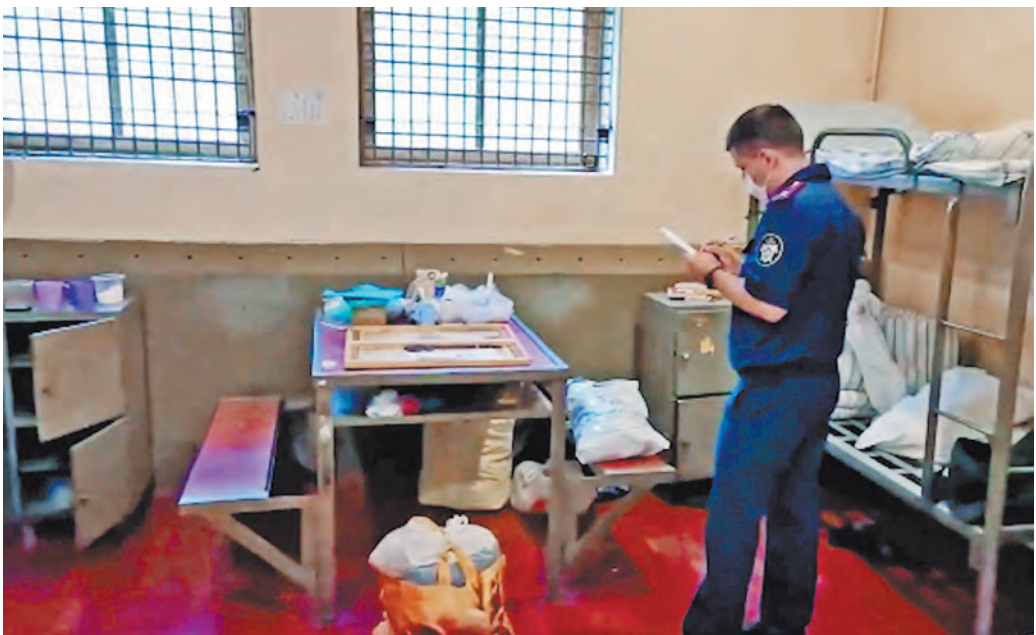
Из семерых обитателей этой камеры в истринском ИВС пять подсудимых ушли в бега, двое остались на месте.