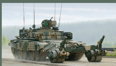
ТАНКИ-ТРАЛЬЩИКИ: ИСТОРИЯ И СОВРЕМЕННОСТЬ