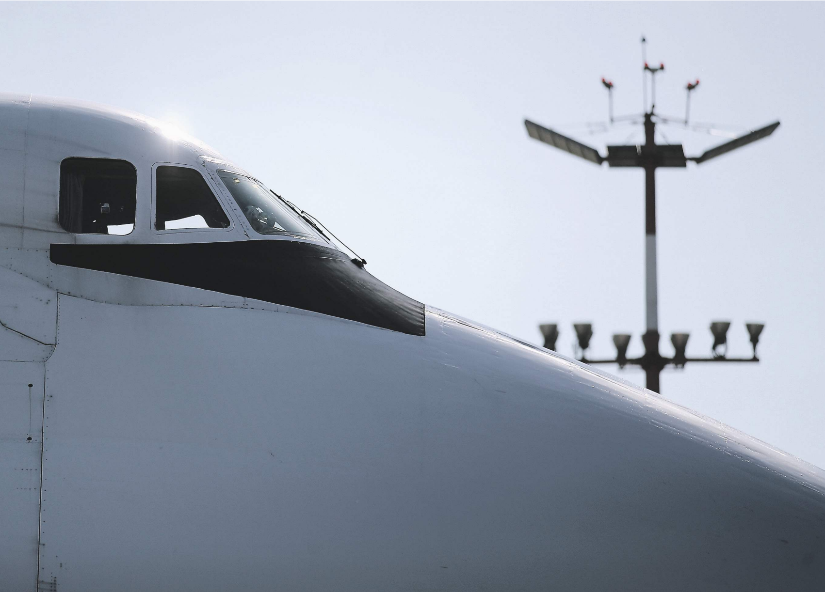
Зурб Даваладзе / «Известия»