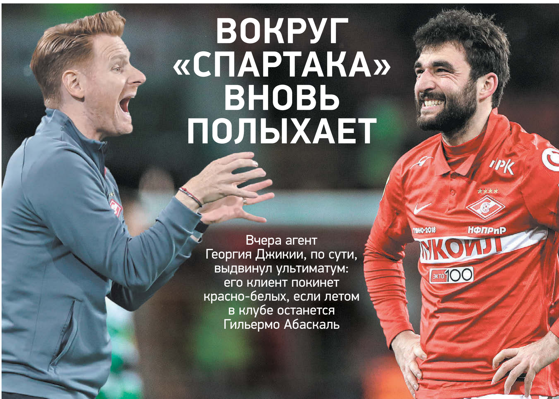
Главный тренер «Спартак» Гильермо Абаскаль