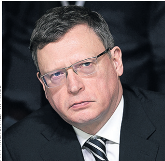
Александр Бурков, губернатор Омской области

Учитывая то, что мощность железнодорожного транспорта практически исчерпаны, а себестоимость авиаперевозок очень высока, водное сообщение становится актуальным как никогда. В наших планах — организация экспериментального рейса через Республику Казахстан в КНР в предстоящий навигационный период. Это позволит наладить взаимные поставки крупногабаритных грузов и частично решить задачу оперативного импортозамещения для ряда секторов экономики. Нужно увеличивать и объемы поставок в Ханты-Мансийский и Ямало-Ненецкий округа. На предстоящем заседании экспертного совета при федеральном минтрансе мы вынесем на обсуждение эти два ключевых вопроса.