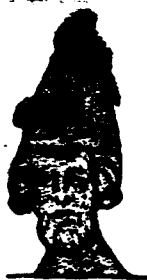
Папа Урбанъ II (Со старинной гравюры).

Шел 1095-й годъ. Въ Римѣ въ это время былъ папой Урбанъ II, который твердо рѣшилъ идти на помощь Византіи. Да и пора было. Императоръ Алексѣй отчаянно умолялъ папу оказать ему поддержку. И папа Урбанъ II рѣшилъ исполнить его просьбу. Объ задумалъ начать дѣло именно съ этого, а затѣмъ, ослабивъ силу турокъ, идти на освобождение Палестины. Онъ хорошо видѣлъ настроеніе народа, но только не былъ увѣренъ въ немъ,—поднимутся ли всѣ на самомъ дѣлѣ такъ