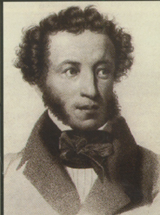
А. С. Пушкин Художник Райт, 1836 год

т. е. о дефиците нашего понимания Пушкина при столь обширном изучении. Положение странное, но ведь чувствуется, что это действительно так. С. Г. Бочаров