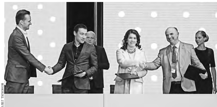
Соглашение о создании в Казани Евразийского отделения придаст новый импульс развитию общественных пространств Татарстана.