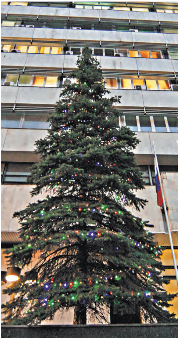
С Новым годом, наши дорогие читатели! Тепла, счастья и радости каждой семье и каждому дому!

ДОКУМЕНТ В НОМЕРЕ Утверждены рекомендации по определению зарплат бюджетников