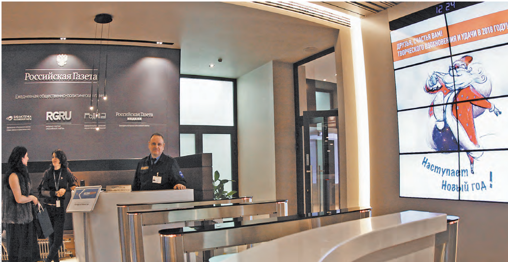
Народу — о власти, власти — о народе. Это не только рабочий слоган нашего издательского дома. Для нас важно, чтобы все слышали друг друга.

Мы бесконечно ценим, что среди наших авторов и подписчиков — не только известные юристы России, но и студенты юридических вузов страны. Мы признательны нашим экспертам, известным академикам, ученым, врачам. Уровень любого издания