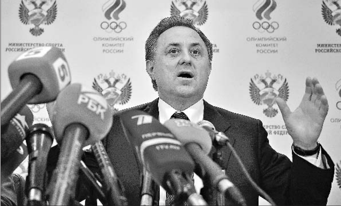
Роман СЕНТЯКОВ/РИА Новости