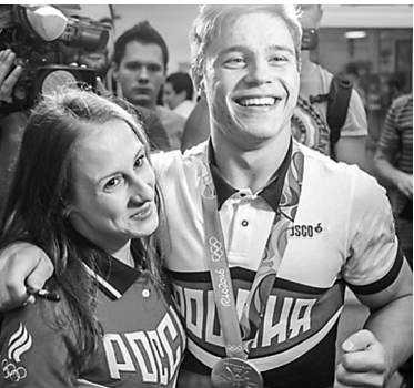
Никита Нагорный, серебряная медаль.