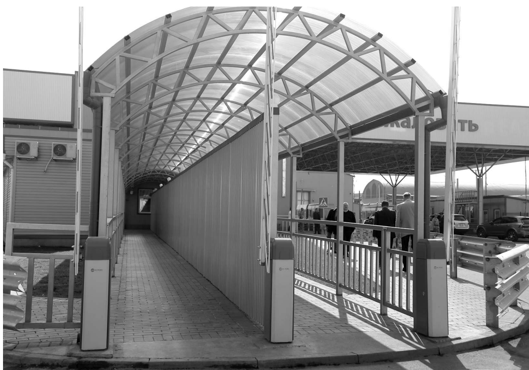
ПРЕСС-СЛУЖБА ПРАВИТЕЛЬСТВА КР