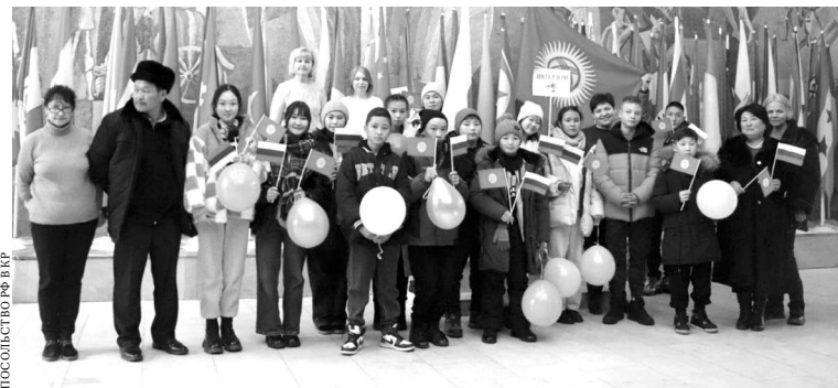
ПОСОЛЬСТВО РФ В КР