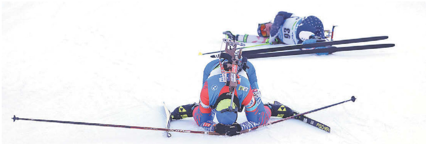
Суббота. Поклюка. На чемпионате мира у нашей сборной пока ни одной награды