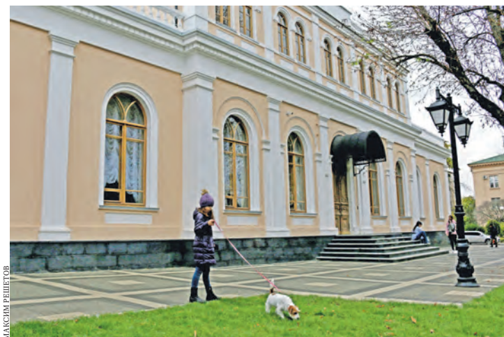
Отреставрированное здание украсило улицу Горького.