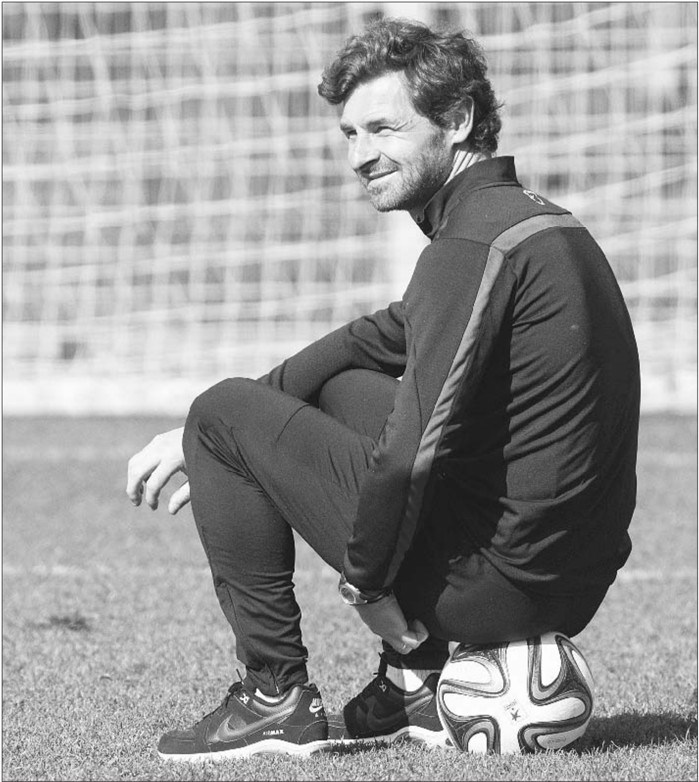
Апрель 2014 года. Санкт-Петербург. Андре Виллаш-Боаш на тренировке «Зенита».